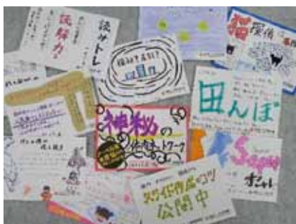
個性あふれる素敵なポップが集まりました

利用の準備ができたなら、選んだ本人が真っ先に借りて読むことができます。そして、選んだ本の中でとくに「おすすめの本」についてポップを作成し、その魅力をアピールします。