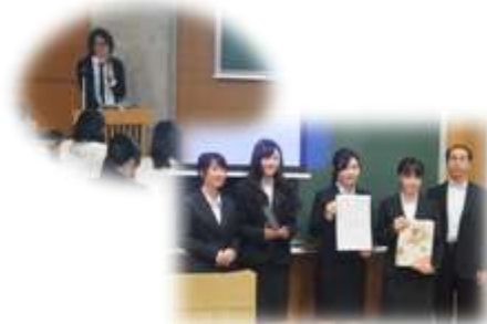
平成28年度 研究成果発表会の様子